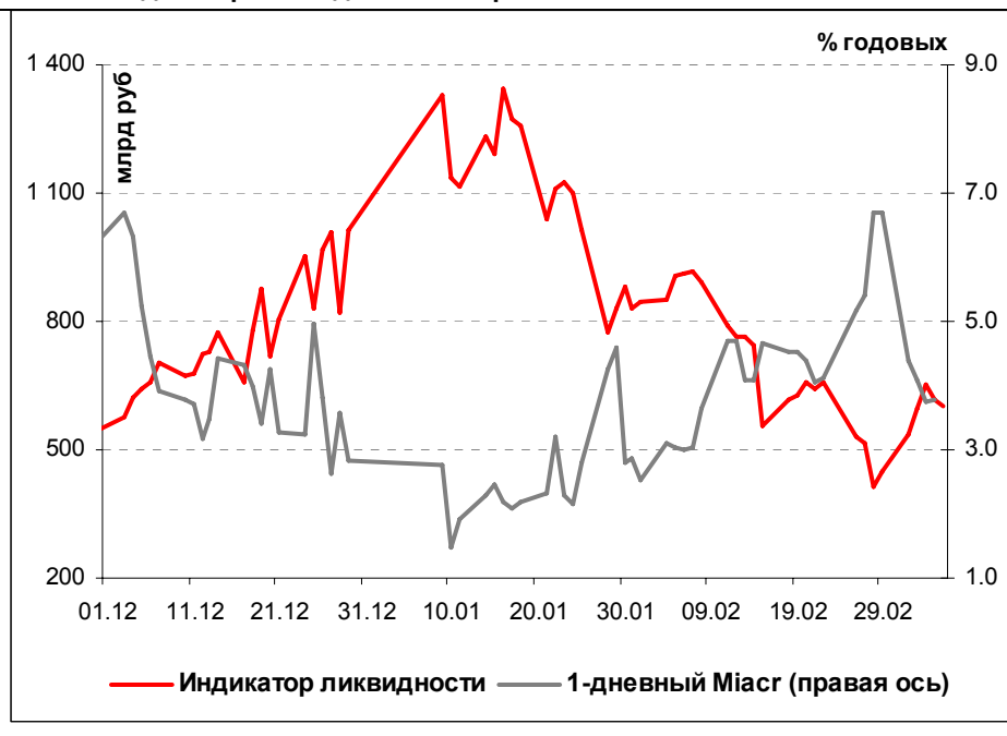
Илл. 1. Индикатор Ликвидности Альфа-Банка