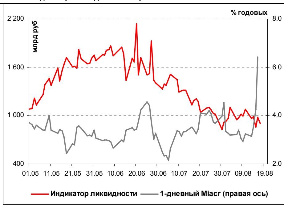
Илл. 1. Индикатор Ликвидности Альфа-Банка