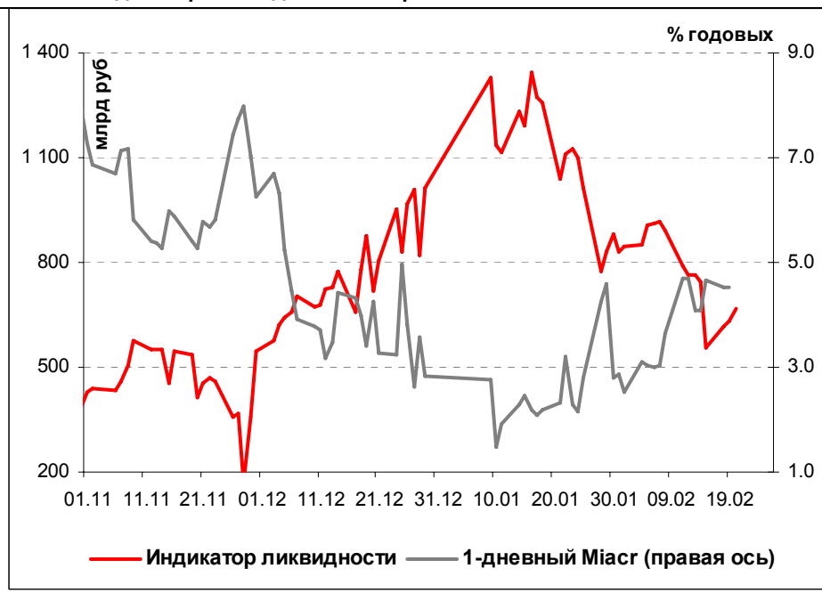
Илл. 1. Индикатор Ликвидности Альфа-Банка