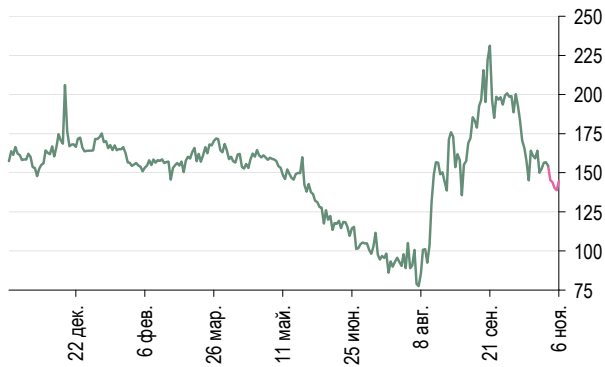
РСХБ-2 – РСХБ 10