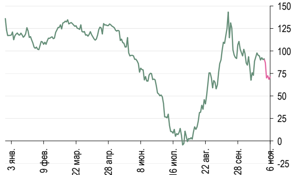
Газпром-08 – Газпром 13