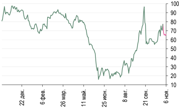
ОФЗ 46017 – Россия 30