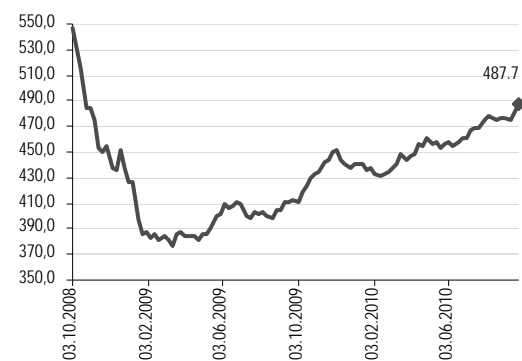
Международные резервы ЦБ, млрд долл.

Рубль вчера несколько ослаб по отношению к доллару, несмотря на рост котировок нефти. Национальная валюта потеряла 13 копеек по отношению к доллару (курс закрытия на ММВБ составил 30,55 руб./долл.). Евро продолжил укрепление, прибавив вчера 37 копеек по отношению к рублю до 41,79 руб./евро. Сегодня рублю окажут поддержку цены на нефть, остающиеся на двухмесячном максимуме (баррель Brent торгуется выше 82 долл.) и может укрепиться до 30,5–30,4 руб./долл., но, скорее всего, продолжит терять позиции по отношению к евро.