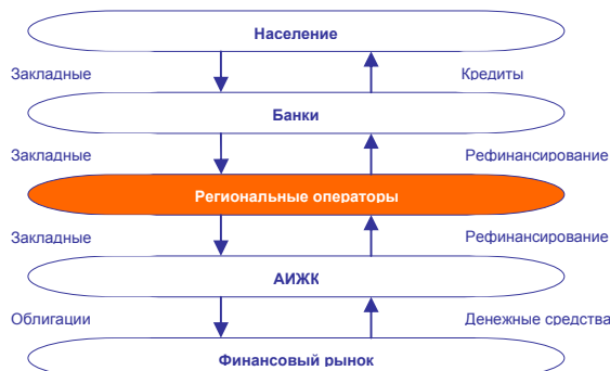
Схема рефинансирования ипотечных закладных в системе АИЖК РФ