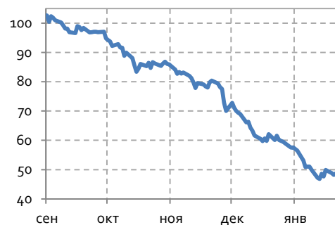
Динамика цен на нефть Brent, usd за барр.