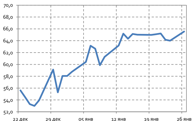
Курс доллара к рублю