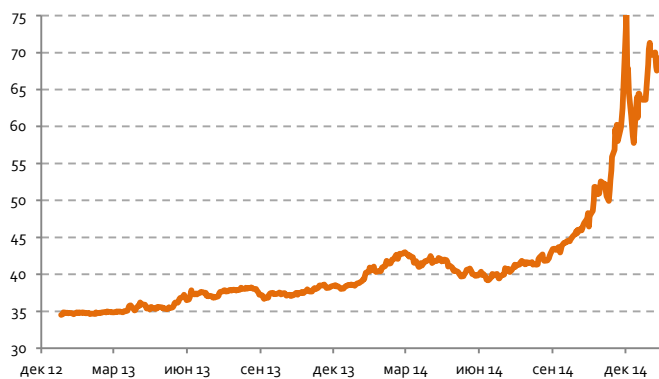
Стоимость бивалютной корзины