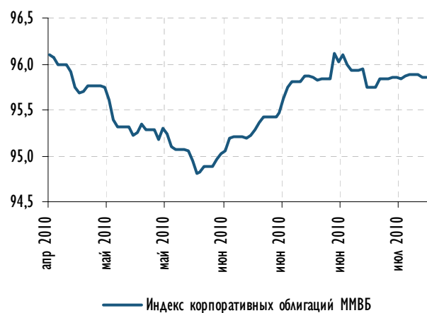
Индекс корпоративных облигаций ММВБ