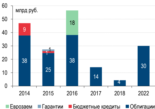
Диаграмма 1. График погашений госдолга Москвы по состоянию на 01/01/14