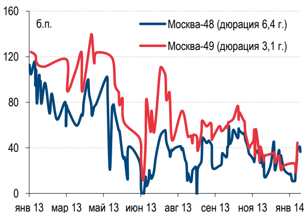
Диаграмма 3. Динамика спредов выпусков г. Москвы к ОФЗ