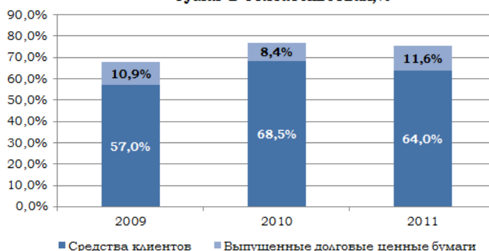
Доля клиентских средств и долговых ценных бумаг в обязательствах, %

Банк поддерживает приемлемый уровень рентабельности, по итогам 2011 года показатель ROAE составил 17,6%, а ROAA – 1,8%.