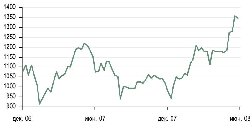
Рисунок 2. Цены на бензол (FOB Роттердам), USD/тонну