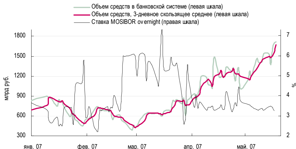
Рисунок 1. Динамика рублевой ликвидности в банковской системе