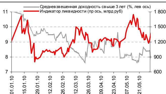
Илл. 1: Ликвидность и доходности корпоративных облигаций