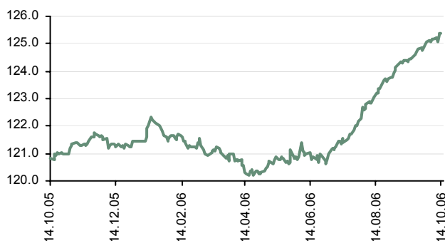
Рисунок 1. Индекс РК по корпоративным и муниципальным рублевым облигациям