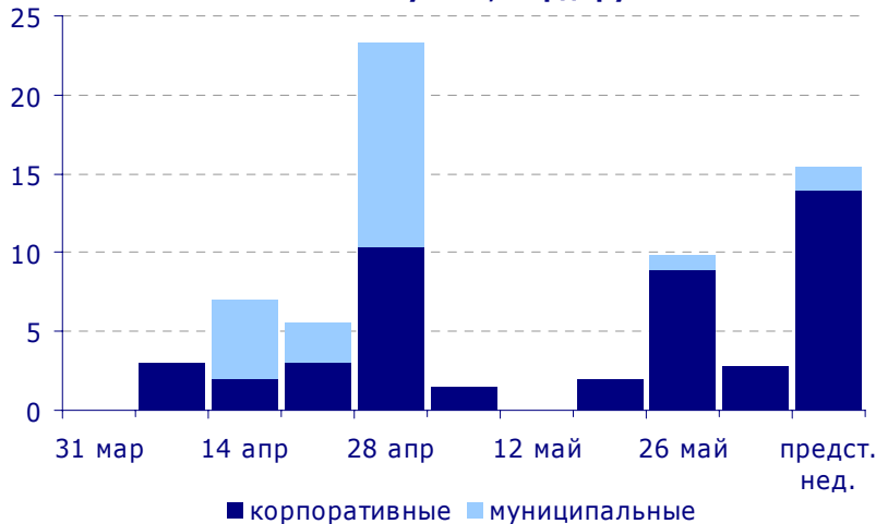
Объем выпусков, млрд. руб