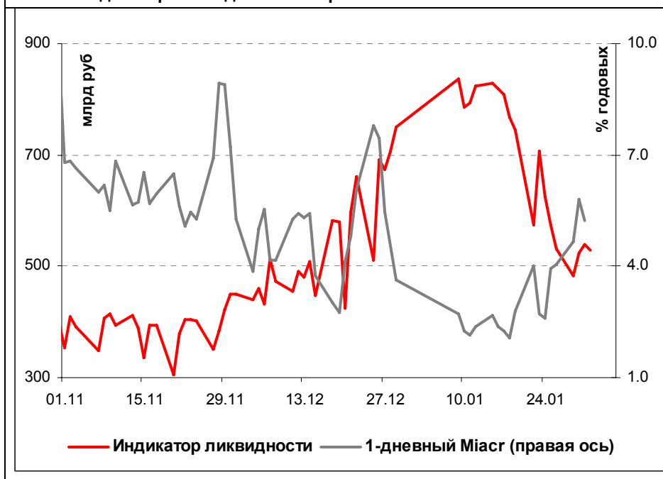
Илл. 1. Индикатор Ликвидности Альфа-Банка