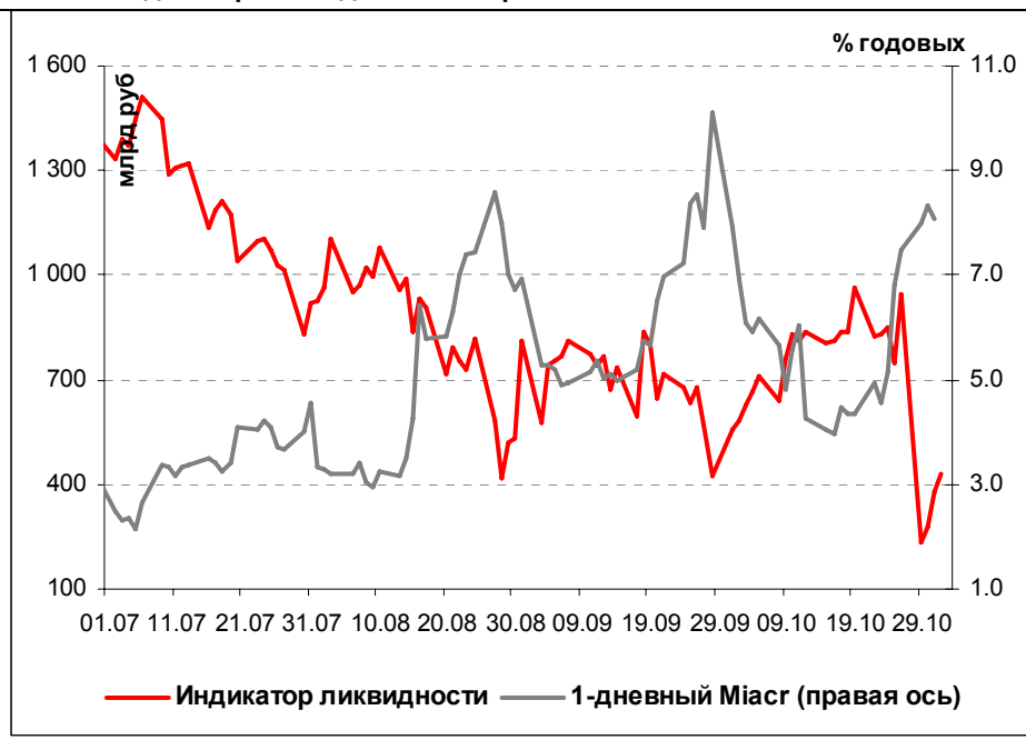
Илл. 1. Индикатор Ликвидности Альфа-Банка