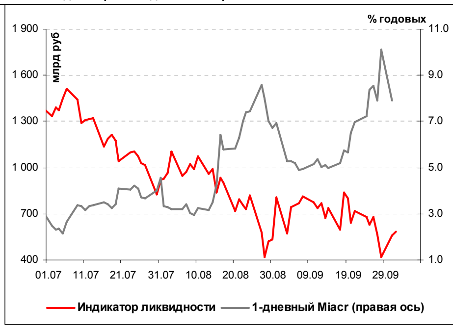
Илл. 1. Индикатор Ликвидности Альфа-Банка