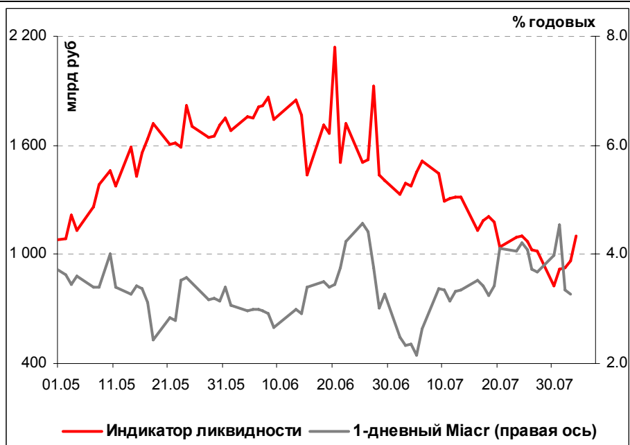
Илл. 1. Индикатор Ликвидности Альфа-Банка