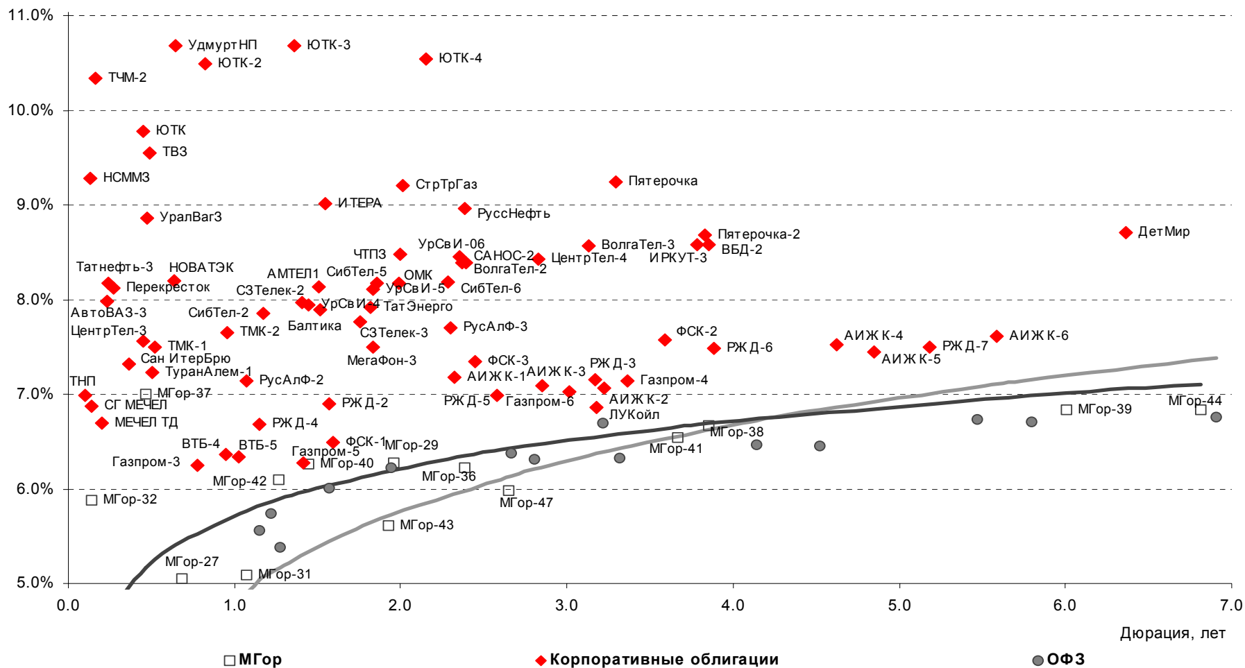
Илл. 7. Доходность рублевых облигаций