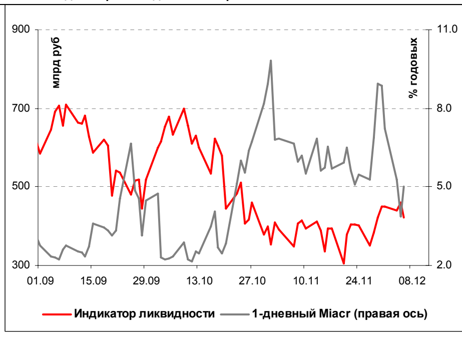
Илл. 1. Индикатор Ликвидности Альфа-Банка