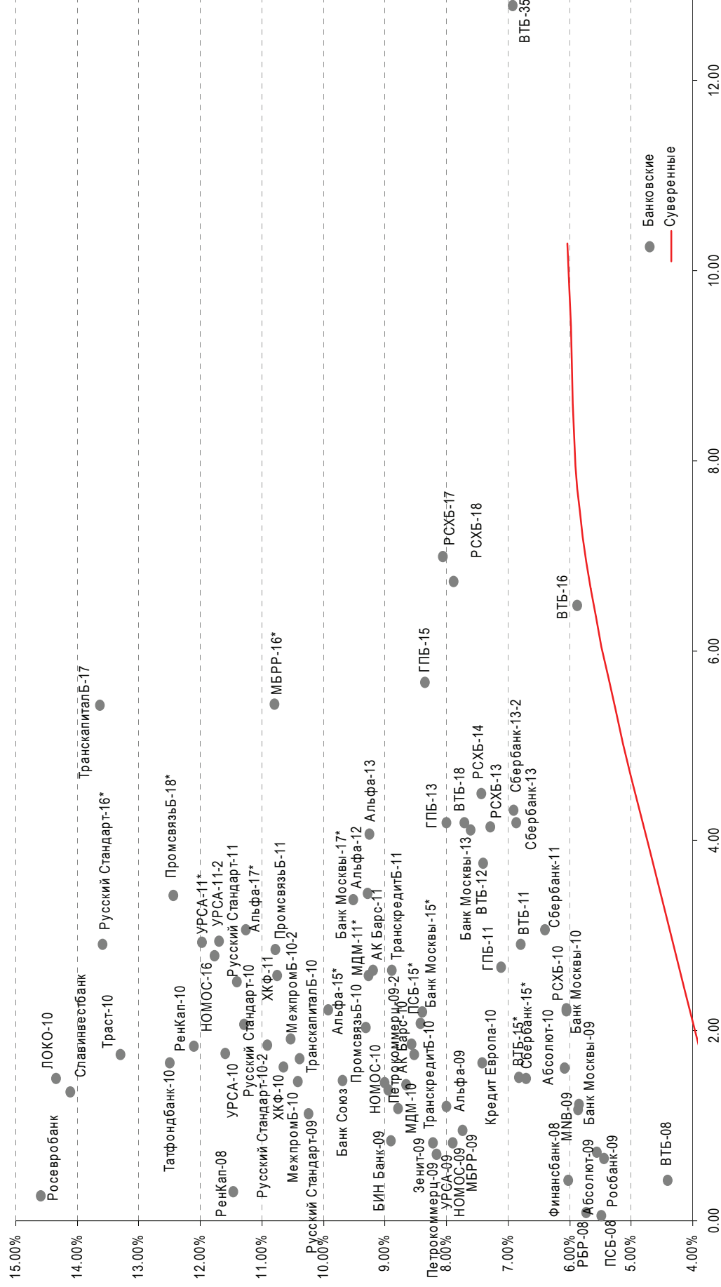
Илл. 6. Доходность российских еврооблигаций банковского сектора