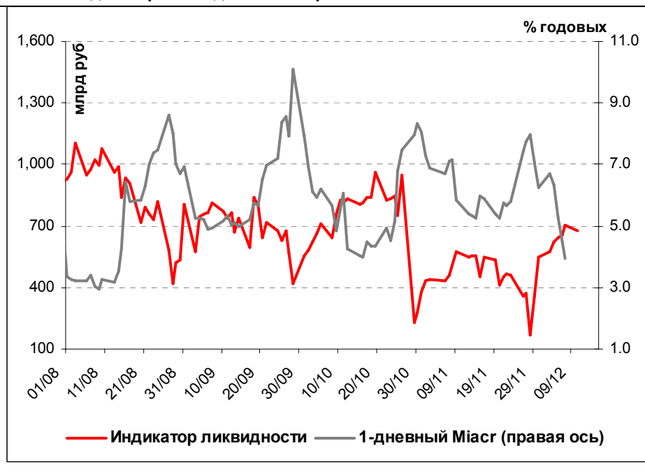
Илл. 1. Индикатор Ликвидности Альфа-Банка