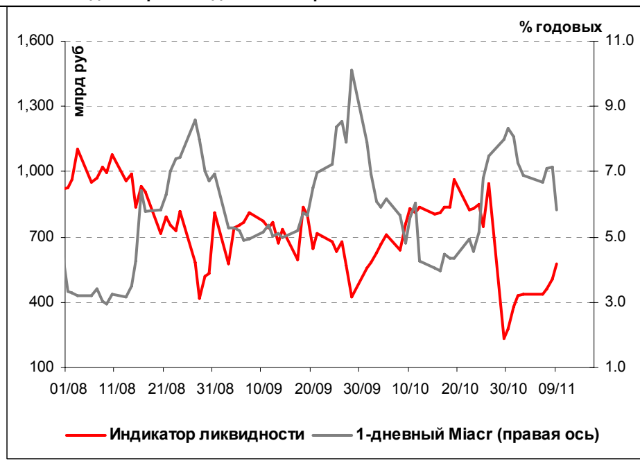
Илл. 1. Индикатор Ликвидности Альфа-Банка