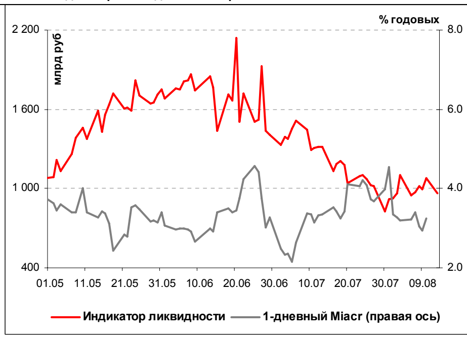
Илл. 1. Индикатор Ликвидности Альфа-Банка