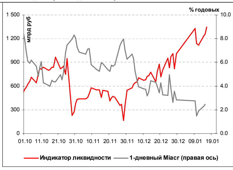
Илл. 1. Индикатор Ликвидности Альфа-Банка