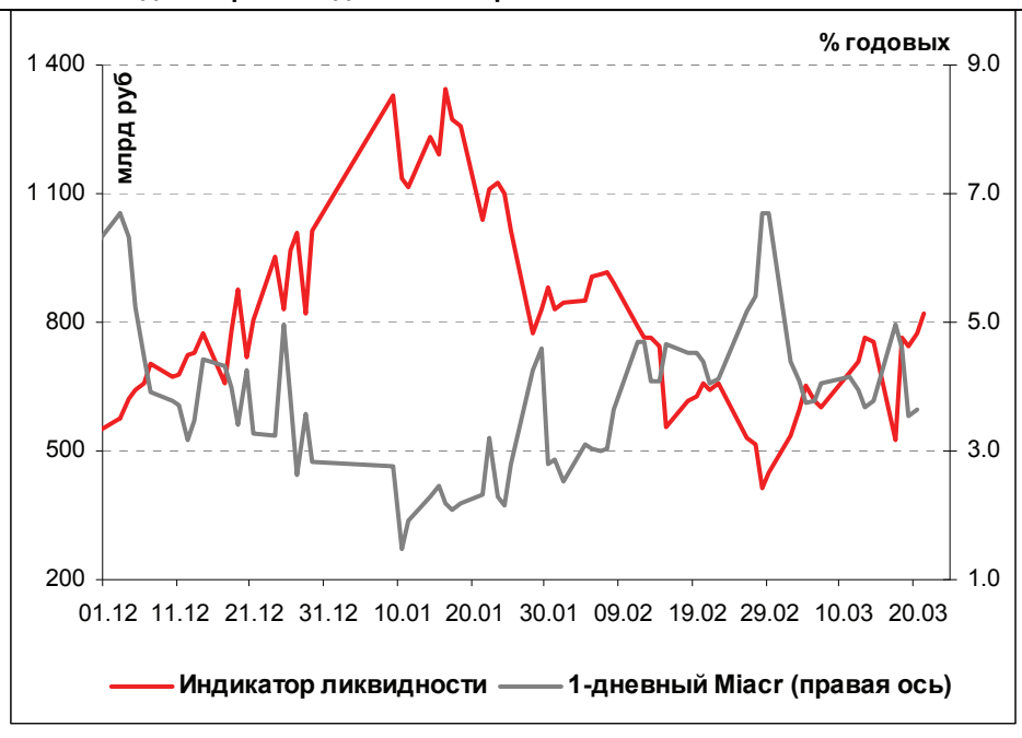
Илл. 1. Индикатор Ликвидности Альфа-Банка