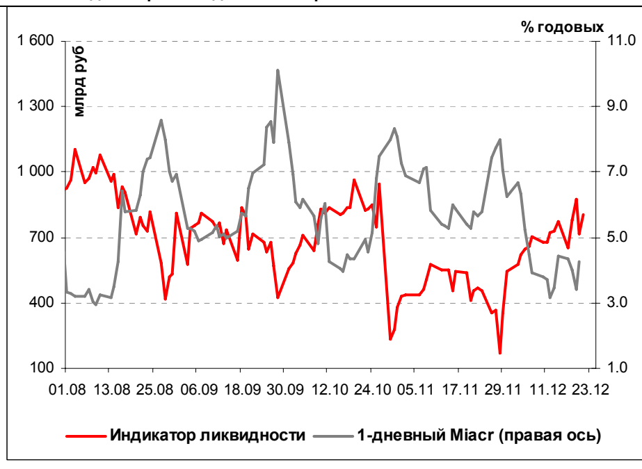
Илл. 1. Индикатор Ликвидности Альфа-Банка