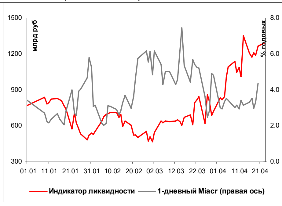
Илл. 1. Индикатор Ликвидности Альфа-Банка