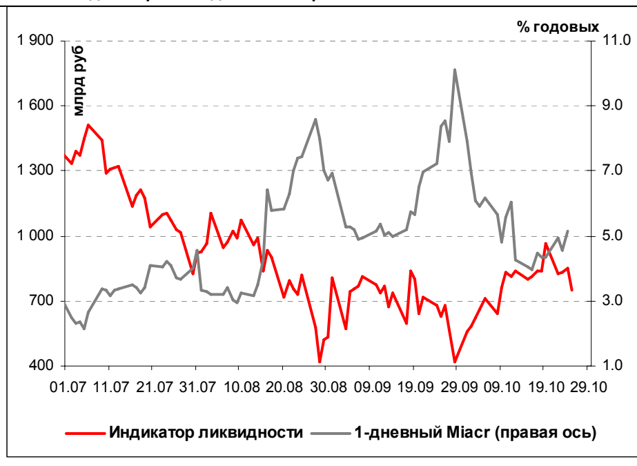
Илл. 1. Индикатор Ликвидности Альфа-Банка