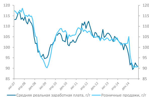
Диаграмма 2. Динамика розничных продаж и реальной заработной платы в РФ, г/г, индекс.

Данные: Thomson Reuters; Расчеты: Банк «Санкт-Петербург»