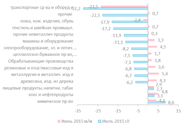
Диаграмма 1. Динамика обрабатывающих отраслей промышленности РФ, июль 2015 в измерении м/м и г/г, %.

Данные: Thomson Reuters; Расчеты: Банк «Санкт-Петербург»