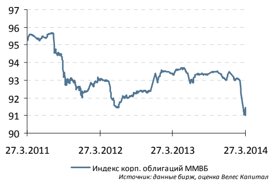
Индекс корп. облигаций ММВБ