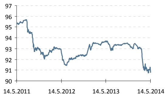
Индекс корп. облигаций ММВБ

— Индекс корп. облигаций ММВБ