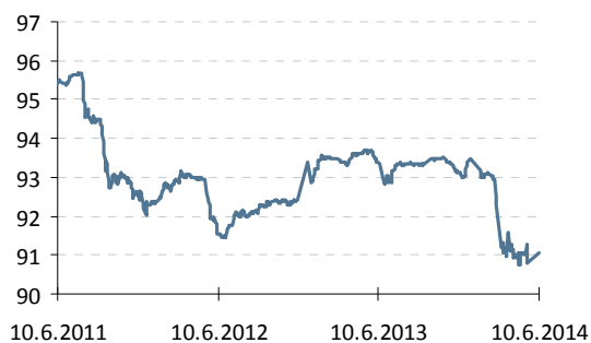
Индекс корп. облигаций ММВБ

— Индекс корп. облигаций ММВБ