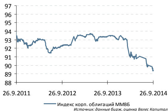
Индекс корп. облигаций ММВБ