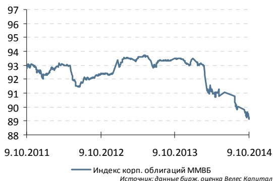
Индекс корп. облигаций ММВБ