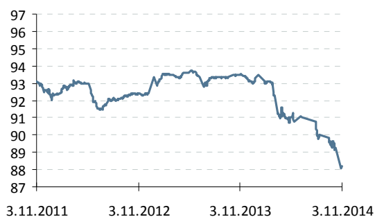
Индекс корп. облигаций ММВБ

— Индекс корп. облигаций ММВБ