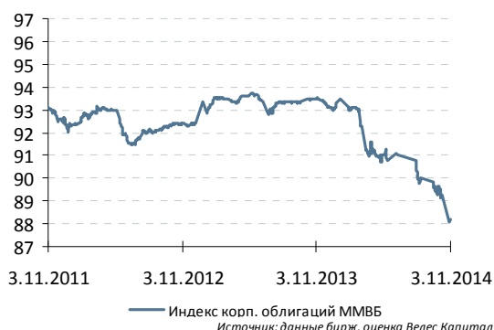
Индекс корп. облигаций ММВБ