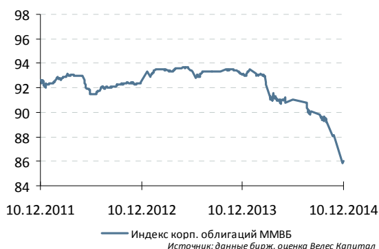
Индекс корп. облигаций ММВБ