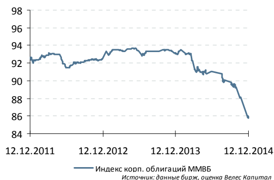
Индекс корп. облигаций ММВБ