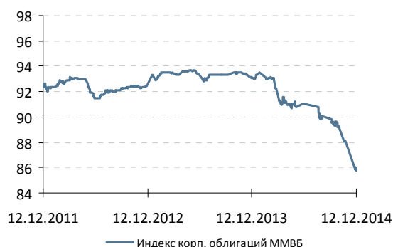
Индекс корп. облигаций ММВБ