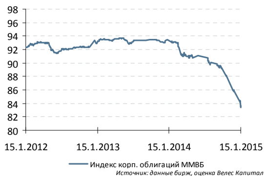
Индекс корп. облигаций ММВБ