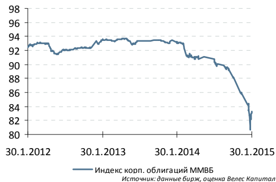
Индекс корп. облигаций ММВБ