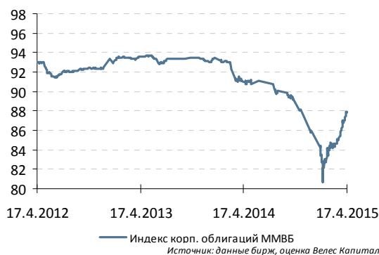
Индекс корп. облигаций ММВБ

Премия к вторичному рынку и нехватка свежих займов делают участие в размещении привлекательным внутри озвученного диапазона