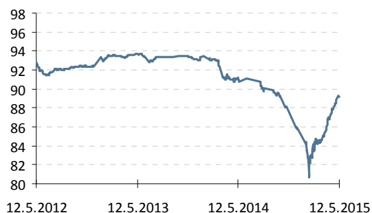
Индекс корп. облигаций ММВБ

— Индекс корп. облигаций ММВБ