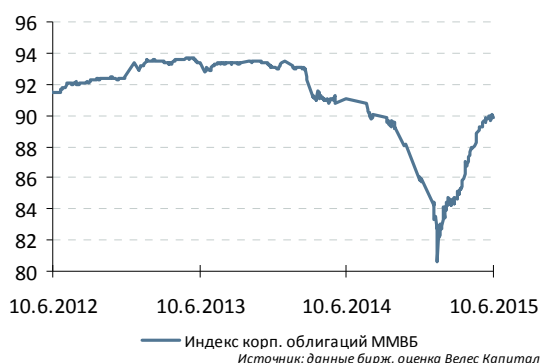
Индекс корп. облигаций ММВБ