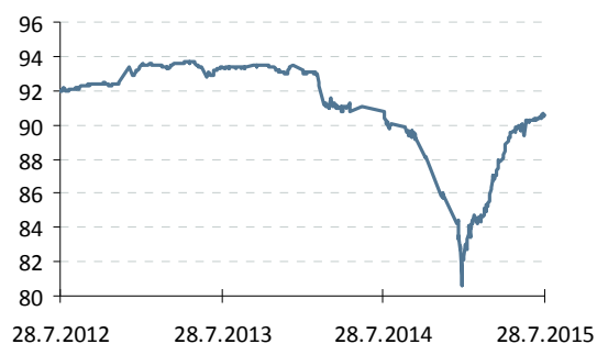
Индекс корп. облигаций ММВБ

— Индекс корп. облигаций ММВБ