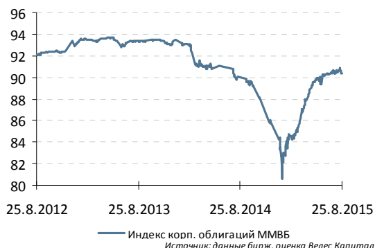
Индекс корп. облигаций ММВБ