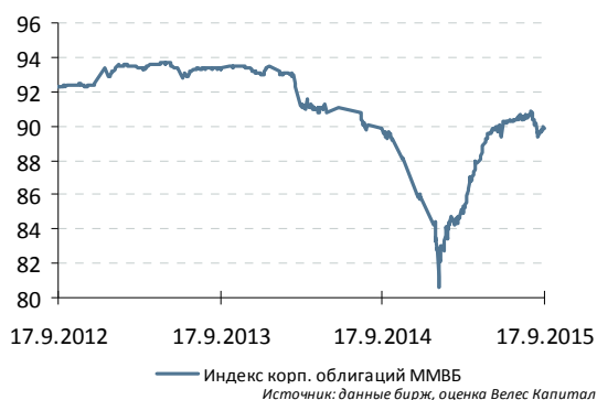
Индекс корп. облигаций ММВБ