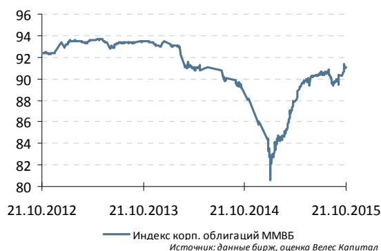
Индекс корп. облигаций ММВБ